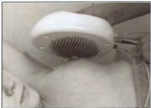
Рис. 2. Укладка панели МЭИК 5.6 к поверхности молочной железы

Методика исследования заключается в том, что после сбора анамнеза, занесения данных в компьютерную программу, осмотра и пальпации молочную железу увлажняют и панель, состоящую из 256 электродов окружностью 12 см, прикладывают к молочной железе так, чтобы световой маркер соответствовал соску (рис. 2). Изменяя положение прибора, достигают максимального количества контактов. Нажав кнопку «старт» на передней поверхности панели или на мониторе компьютера, запускают процесс измерения (рис. 3) длительностью 20 с, после которого запускается процесс реконструкции изображения.