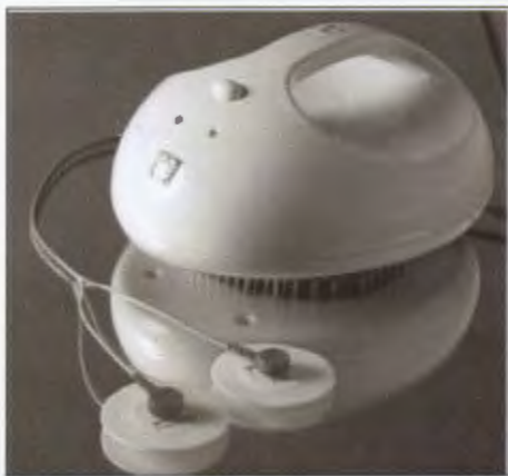
Рис. 1. Электроимпедансный компьютерный маммограф МЭИК

удельного сопротивления (или электропроводности) в ней, информируя о физиологических и патологических процессах в молочной железе, таких как рак, фиброзно-кистозная мастопатия, мастит, инволюция, лактация и др.